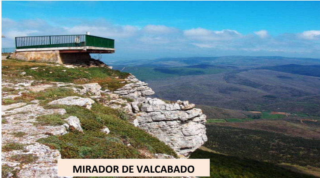
MIRADOR DE VALCABADO