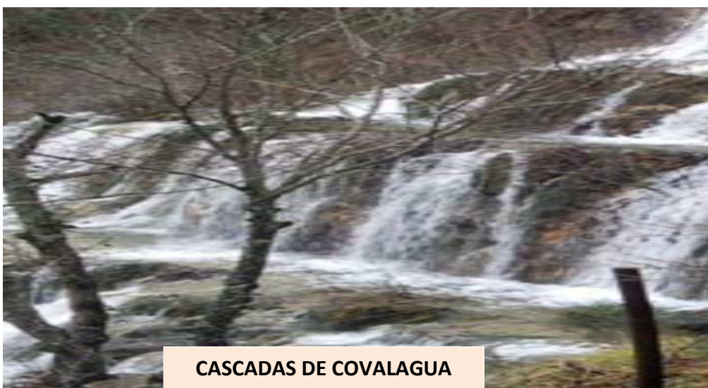
CASCADAS DE COVALAGUA

En las inmediaciones de la cueva hay varios menhires , de los que el de Canto Hito está aún en pie y puede visitarse en una ruta señalizada que parte desde la cueva.