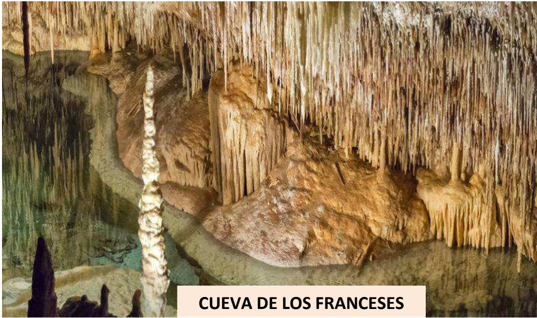
CUEVA DE LOS FRANCESES

Se fletarán dos autocares que harán los recorridos a la inversa para no formar grupos muy numerosos. Uno irá directamente a las cuevas de los franceses y el otro a las Cascadas de Covalagua. Se dará número a las Excursiones según vayan llegando. Las inscripciones hasta completar los dos autocares. Si sobrarán plazas se podrán inscribir en la propia acampada.